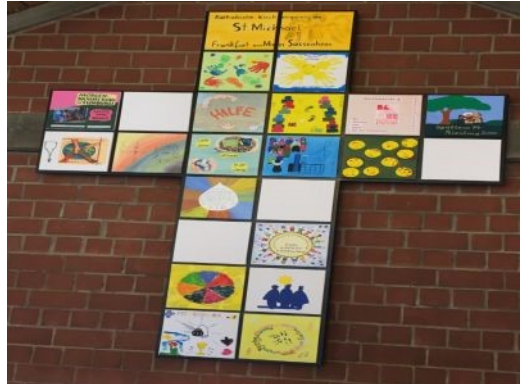
Gemeindekreuz aus gestalteten Kacheln der Gremien, Gruppen und Kreise

Spendenkonto: Frankfurter Volksbank IBAN: DE 73 5019 0000 6200 1867 27 BIC: FFVBDEFF