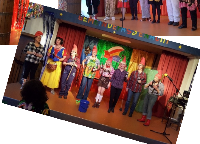
Bilder Manfred Krüger