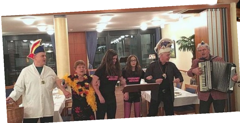
Bilder St. Johannes