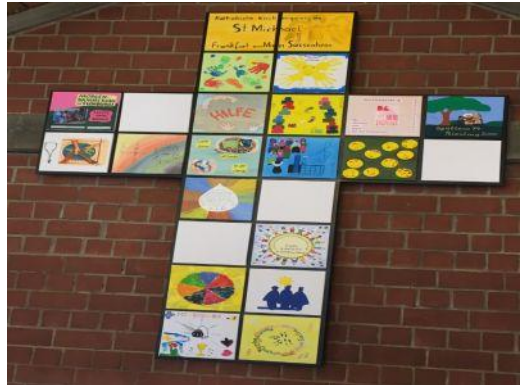
Gemeindekreuz aus gestalteten Kacheln der Gremien, Gruppen und Kreise

Spendenkonto: Frankfurter Volksbank IBAN: DE 73 5019 0000 6200 1867 27 BIC: FFVBDEFF