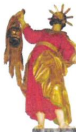
Bartholomäusfigur in St. Bartholomäus, Zeilsheim