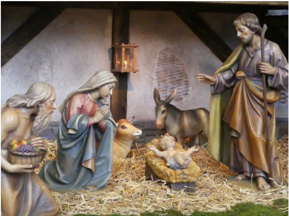
Weihnachtskrippe St. Michael (Detail)

Nr. 12/01 12.12.2021 –09.01.2022 4./5. Jahrgang