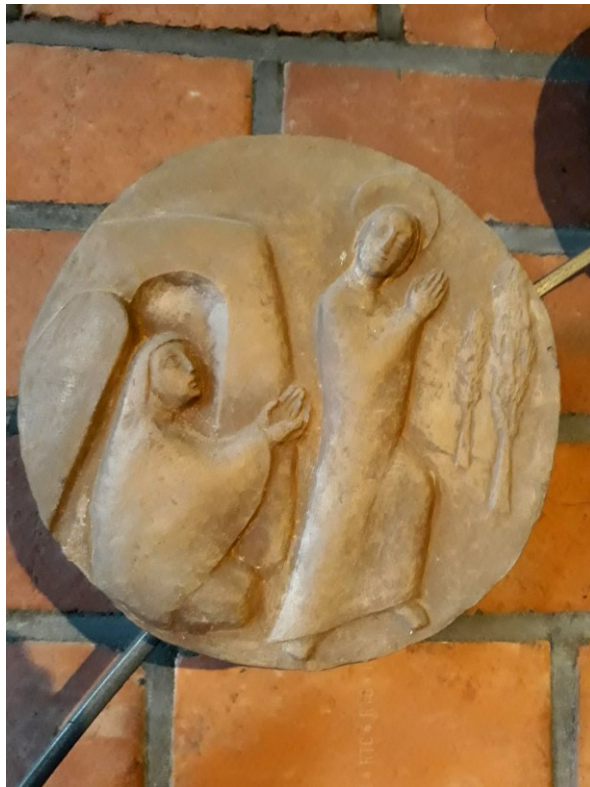
Bild: „Maria Magdalena begegnet dem Auferstandenen am Ostermorgen“, aus dem Rosenkranzrelief-Zyklus von Gertrud Scherer in der Kirche St. Michael, Sossenheim