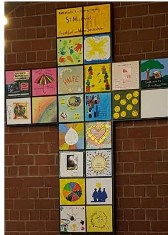
Gemeindekreuz aus gestalteten Kacheln der Gremien, Gruppen und Kreise

Spendenkonto: Frankfurter Volksbank IBAN: DE 73 5019 0000 6200 1867 27 BIC: FFVBDEFF