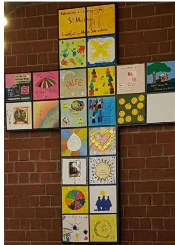
Gemeindekreuz aus gestalteten Kacheln der Gremien, Gruppen und Kreise

Spendenkonto: Frankfurter Volksbank IBAN: DE 73 5019 0000 6200 1867 27 BIC: FFVBDEFF