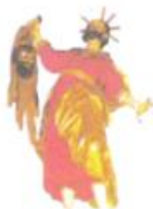
Darstellung des Heiligtums in der Kirche in Zolters

Katholische Pfarrei Sankt Margareta Frankfurt am Main