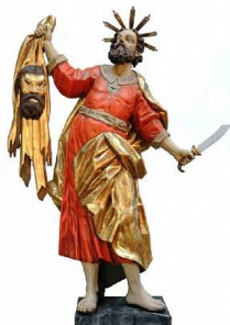
Darstellung des Hl. Bartholomäus in der Kirche in Zelshelm