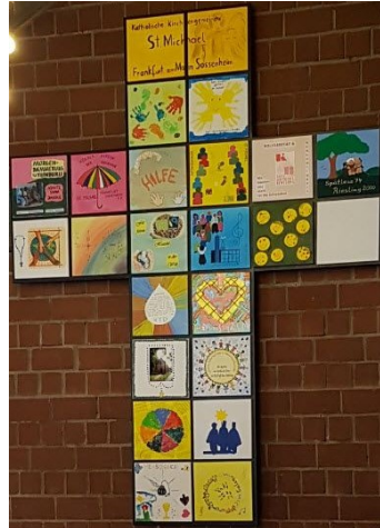
Gemeindekreuz aus gestalteten Kacheln der Gremien, Gruppen und Kreise

Spendenkonto: Frankfurter Volksbank IBAN: DE 73 5019 0000 6200 1867 27 BIC: FFVBDEFF