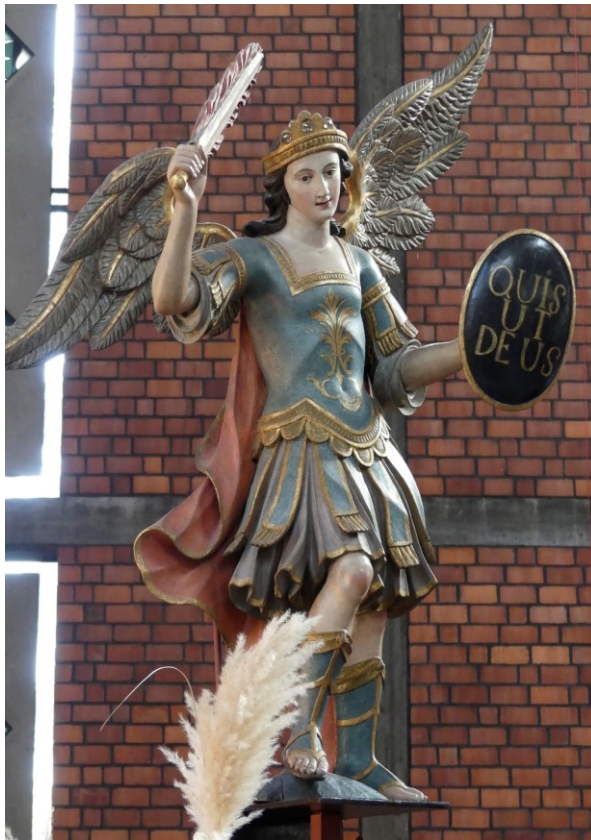
Hl. Michael (1750) in der Kirche St. Michael, Sossenheim

Nr. 09/10 11.09.2022 –16.10.2022 5. Jahrgang