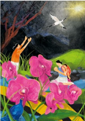
Bild zum Weltgebetstag

Wir danken allen Familien und Einzelpersonen, die ein Adventsfenster und das dazu gehörende Treffen gestaltet haben. Am 24. Dezember öffnete sich wie immer um 16.00 Uhr in der Kirche im Rahmen des Familiengottesdienstes zum Weihnachtsfest das 24. Fenster in Gestalt einer großen Leinwand, auf der der Krippenspielfilm der Pfarrei gezeigt wurde.