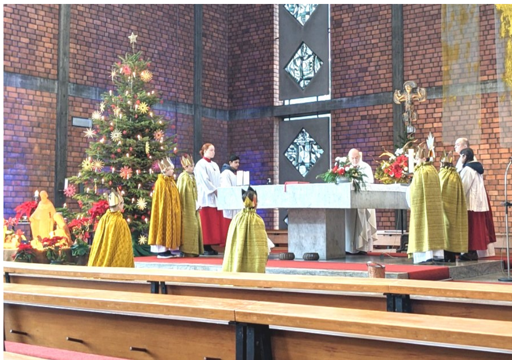
Gottesdienst mit den Sternsinger:innen am 8.1.2023

Nr. 2 15.01.2023 –19.02.2023 6. Jahrgang