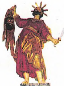
Bartholomäusfigur in St Bartholomäus, Zeilsheim