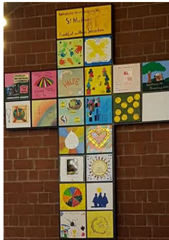
Gemeindekreuz aus gestalteten Kacheln der Gremien, Gruppen und Kreise

Spendenkonto: Frankfurter Volksbank IBAN: DE 73 5019 0000 6200 1867 27 BIC: FFVBDEFF